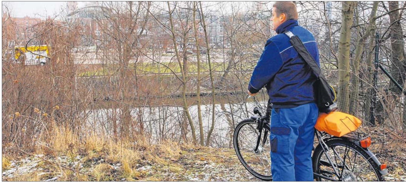
Da könnte gebaut werden: ein 100 Meter langer Weg bis zum Stadtgraben und eine 50 Meter lange Brücke über das Wasser.

Die Stadt verteilt kostenlose Verhütungsmittel an verdiente Aktivisten. Um damit nicht das Wachstum der Sozialistischen Hansestadt zu gefährden, werden vorzugsweise Kondome aus dem Nachlass des VEB Gummiwerke „Werner Lamberg“ (Erfurt) ausgegeben.